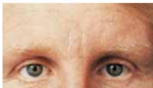
Hrukkur/línur milli augna eftir