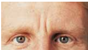
Hrukkur/línur milli augna fyrir