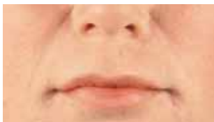
Nef/munnlinur og varir eftir