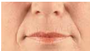
Nef/munnlinur og varir fyrir