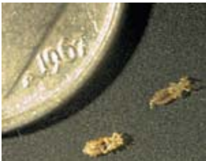
Nit í hlutfalli við títuprjón

Hún byrjar strax að sjúga blóð því hún verður að fá næringu annars deyr hún. Nitín gengur í gegnum þrjú þroskastig á fyrstu 9-12 dögnum áður en hún er fullorðin og getur sjálf orpið eggjum: Hún hefur hamskipti þrisvar og verður tvisvar til þrisvar sinnum lengri en hún var þegar hún klaktist út.