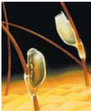
Lúsaregg á hári

Kvenlús verpir eggjum sínum í hársvörð. Eggin sitja föst á hárinu á „stilk“. Lúsaregg er beinhvítt og um 0,8 millimetra langt. Að 6–9 dögum liðnum þegar lúsín er fullproskuð dettur lok af efst á egginu. Eggjaskurnin situr eftir á hárinu og vex út með því þar til hún er greidd eða klippt af. Egg sem sitja meira en einn sentimetra frá hársverði eru vanalega annaðhvort klakin eða dauð.